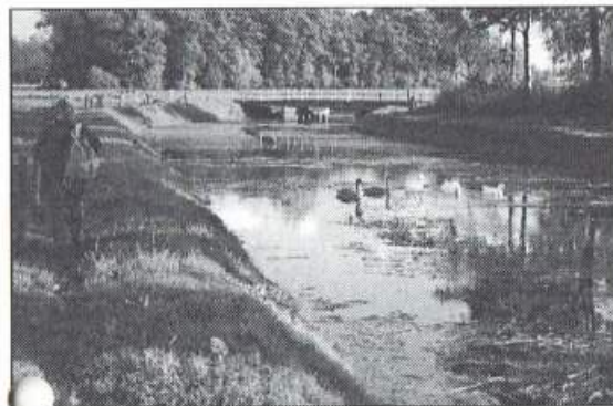
'Natuurlijk, het was heerlijk lopen over die graspaden langs de rechtgetrokken beken en 'waterleidingen'... (Salland, najaar 1996)

Op de deel van een zuivelbedrijf bij Raalte kreeg ik een echte knapzak op stok overhandigd met ondermeer een zalig gekruid brandnetelkaasje en een bakje met smeùige hangop, gemengd met verse vruchten, heerlijk! Hangop