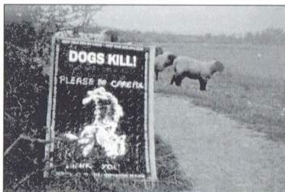
Loslopende honden niet alleen een Nederlands probleem. Opname langs de South Downs Way, Engeland.

Nederland heeft, zoals bekend, nog maar weinig natuur, laat staan natuur waarin allerlei diersoorten de nodige rust vinden om zich te handhaven. De rode lijsten met bedreigde diersoorten spreken in dat opzicht boekdelen. Loslopende honden verstoren de rust en vormen vaak een directe bedreiging voor op de bodem broedende vogels, schapen, grazers e.d. Niet alleen de verstoring van nesten, maar alleen als de geur van urine kan tot gevolg hebben dat vogels een gebied verlaten. In veel natuurgebieden is het daarom verplicht honden (kort) aangelijnd te houden. In de praktijk blijkt helaas, dat veel hondenbezitters zich niet aan een dergelijk voorschrift houden uit onwetendheid, onverschilligheid of vanuit de gedachte 'Mijn Fikkie doet toch niets' (waarbij de vraag rijst of de hond zelf dat ook weet). Vaak rest de terreinbeheerder dan niet anders dan de toegang met honden geheel te verbieden om de natuurwaarden van een gebied in stand te houden. Dat hierbij, zoals meestal, de goeden onder de slechten lijden is natuurlijk jammer, maar onvermijdelijk. Een goede oplossing voor dit probleem zien wij ook niet direct.