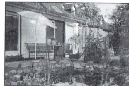
2 Persoons appartement.