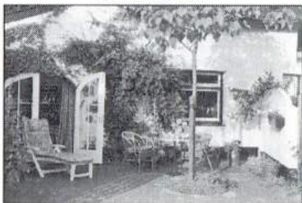
2 – 3 Persoons appartementen

2 Steervolle appartementen in en naast een verbouwd boerderijtje. Gelegen in authentiek Zuid-Limburgs gehuchtje, midden in de heuvels.