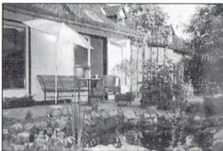
2 Persoons appartement.

Alphen a/d Rijn Zaans Riebedronde (± 15 km)