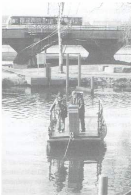
trekpuntje naar Bossche Broek