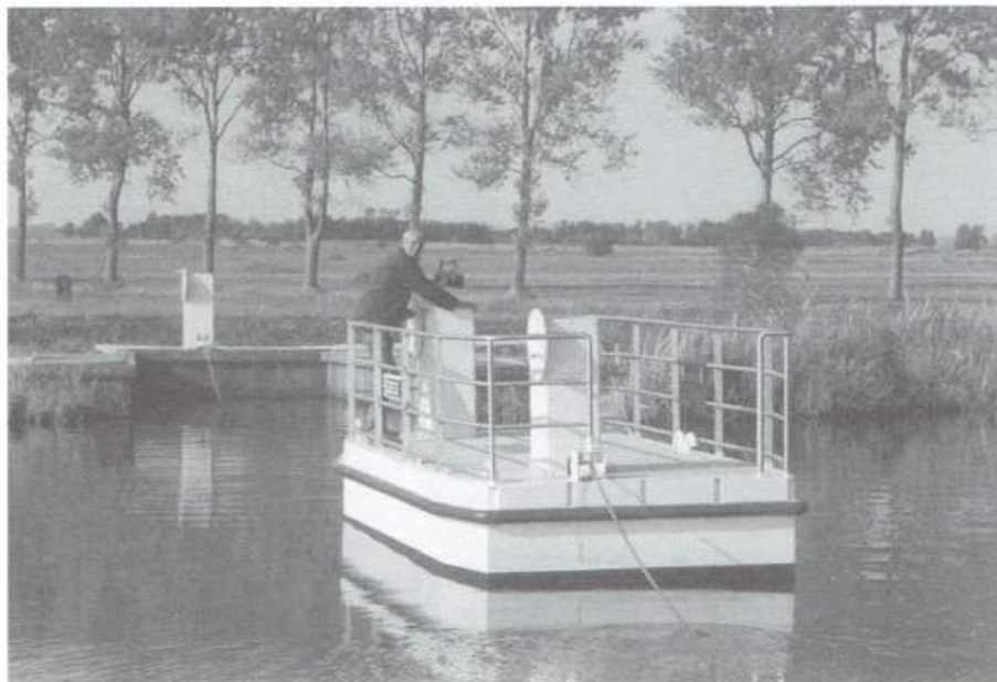
Pontje bij Tijnje

De rubriek 'Op pad met de pont' wordt verzorgd door de Vrienden van de voetveren. Vrijwel alle zelfbedieningspontjes staan vermeld in het overzicht Overzetveren in Nederland, België en de Nederlands - Duitse Grensstreek . Te bestellen door € 10 over te maken op postrekening 5265803 L.n.v. penningmeester Vrienden Voetveren te Wassenaar.