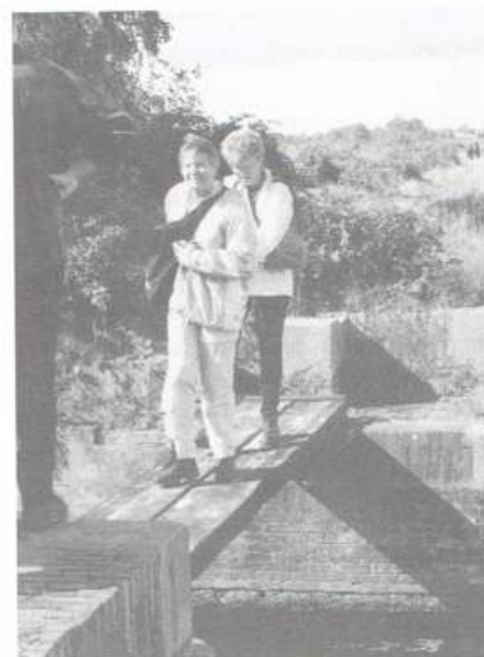
Het raadsel van de balk over de Veldwetering opgelost

Wel bestaan er plannen voor een nieuw voetpad van Scheveningen naar Meijndel. Wij hopen dat dit doorgaat en dat de discussie over fietspad 10, die inmiddels al een halve eeuw woedt, nogmaals zo lang zal duren.