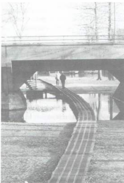
Vlonderpad en ...