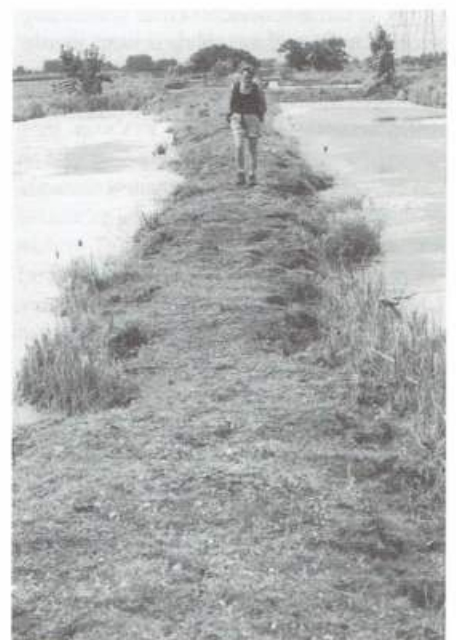
Tiendweg bij Haastrecht

Overigens hebben de tot nu toe al in beeld gebrachte paden, bestaande en nieuwe, al hun waarde bewezen in landinrichtingsprojecten en gebiedsgerichte projecten. Dat verzekeren althans gedeputeerde staten aan de statenleden in een notitie over de stand van zaken rond het Wandelpadenplan. Als concrete projecten noemen zij de wandelpadenplannen voor Midden-Delfland en Voorne-Putten-Rozenburg en de concrete bescherming van enkele onverharde paden bij de Wijde Aa, de Bergvlietkade in de Krimpenerwaard, paden in de Woudse Polder en in Ouddorp-West. In een van de volgende nummers van Lopend Vuur zullen we er meer aandacht aan besteden.