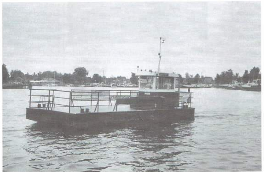
Hin en Wir over It Wiid