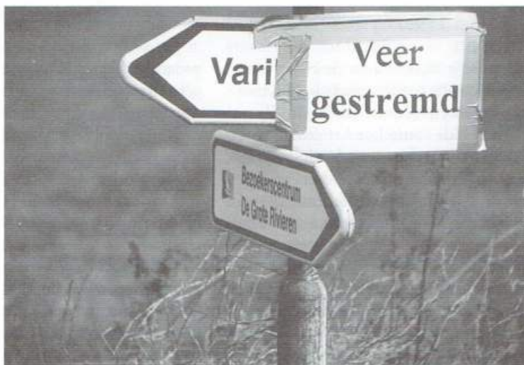
Het zomerveer bij varik is bij hoge en lage waterstanden uit de vaart

Het rivierengebied wacht grote veranderingen. Om de rivier meer ruimte te geven en de kans op overstromingen te verminderen, is zelfs een PKB 'Ruimte