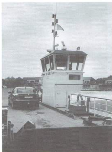
De Burd over het Prinse Margrietkanaal