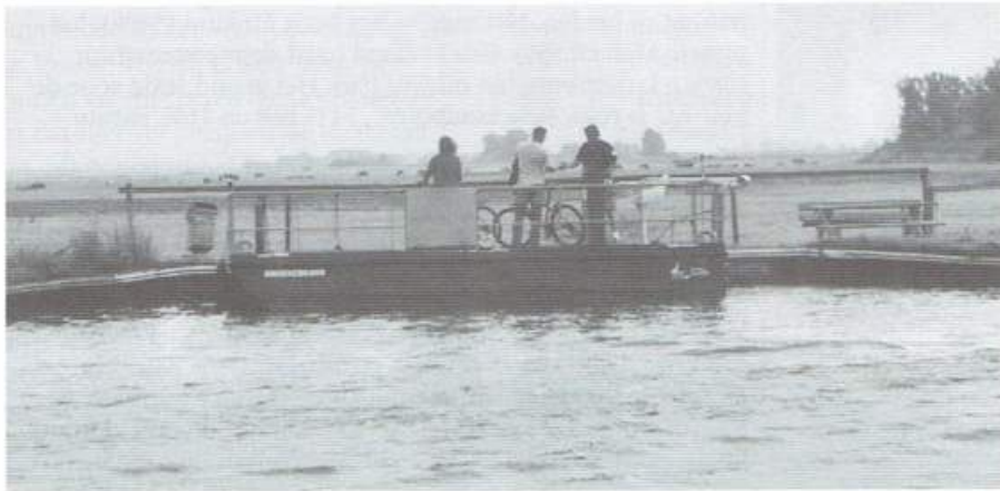
De Snoeckbaers over de Grêft

Ga op een mooie zomerdag naar het Friese Grou om aldaar te genieten van het landschap, de weilanden, de meren, de vaarten. Maar vooral van de vele pontjes. Grou is uniek, vanwege de 8 pontjes die op beperkte afstand van het stadje te vinden zijn. Zelf maakten we een kort rondje van omstreeks 30 km vanuit Grou via Eernewoude en Wartena. En tijdens de tocht hebben we 4 pontjes bevaren. De Stichting Grou Actief is met haar overzichtelijke boekje, De 8 van Grou , behulpzaam bij de selectie van de routes. Het boekje bevat ook informatie over de vaartijden van de pontjes.