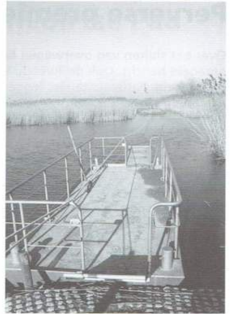
Trekpuntje bij Aerdtseveerstoep

Juist voorbij het Dijkmagazijn LA afdalen over de zomerdijk de Eendepoelsche Buitenpolder in (van 1 oktober tot 1 maart recht door over de Aerdsedijk tot het beginpunt). Bij een bocht naar rechts de zomerdijk blijven volgen; links liggen drie poeltjes, waarschijnlijk restanten van oude dijkdoorbraken. Na een paar honderd meter LA. Bij een rij hoge poulieren RA het pad vervolgen door een laantje met rechts een lange reeks knotwilgen. Aan het einde RA door verwilderde weilanden. Op de zomerkade LA tot bij het veerpontje. RA naar Aerdt.