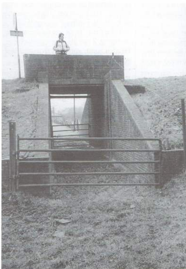
Het 'bruggat' in de Spruitenkamp

Wat je zeker niet moet overslaan als je door de Ooypolder aan het dwalen bent, is het natuurgebied Groenlanden. Daar lopen enkele paden doorheen; over de hoge zandgronden en een defensiedijk, onderdeel van de IJssellinie, kun je vrij rondstruinen. Een deel van het gebied is niet toegankelijk, maar een fraai vormgegeven uitkijktoren biedt een goed zicht op dit deel. De kleiputten vormen een moerasgebied met een sterk schommelend waterpeil. De Waal oefent hier indirect haar invloed uit via het onder de dijk doorsijpelende kwelwater.