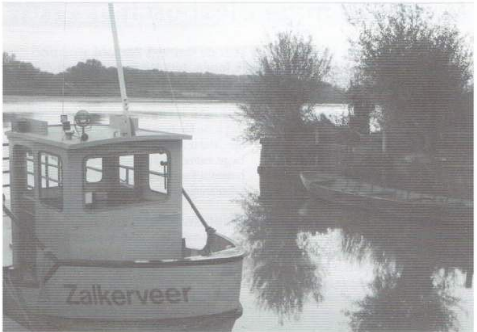
De winnende foto van Rob de Vries: het Zalkerveer in avondstemming

De set van acht ansichtkaarten van de fotowedstrijd is te bestellen door overmaking van € 5,00 op postrekening 5265803 t.n.v. penningmeester Vrienden van de Voetveren te Bilthoven o.v.v. 'set ansichtkaarten fotowedstrijd'.